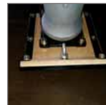
Flexible durable et artisanale en bois laminé et acier