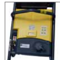
Arrêt moteur sur poignée