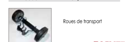
Roues de transport