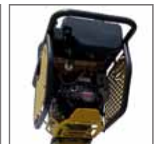
HONDA GX100 ou GXR120