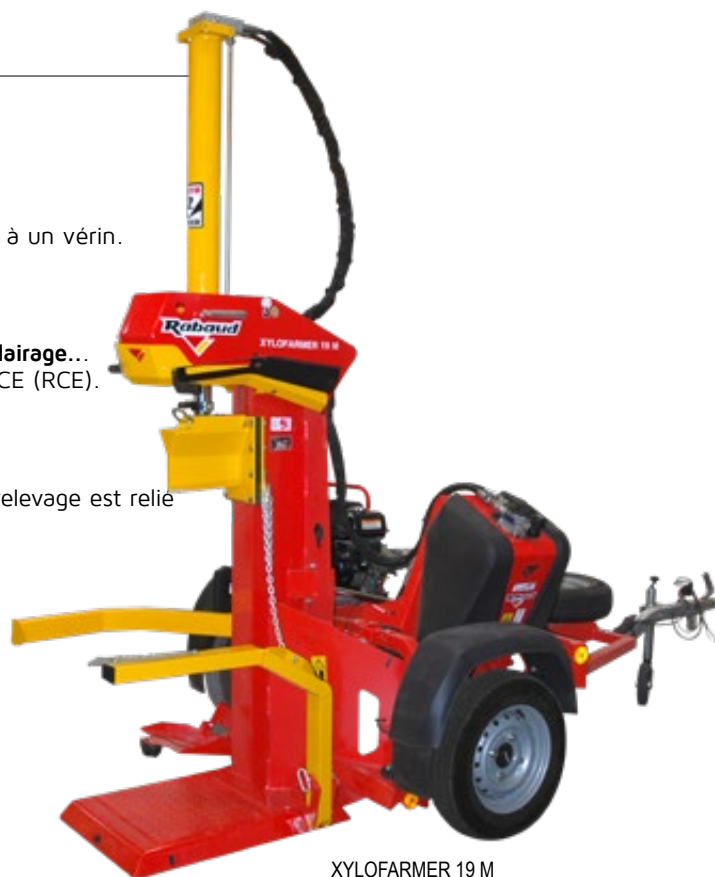
XYLOFARMER 19 M

L'innovation qui fait la différence sur XYLOFARMER (voir page 9)