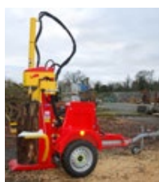
XYLO-SR 18 M au travail