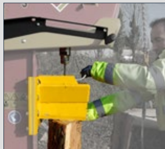
2 - Un système de contre-poids permet de déposer délicatement le coin sur le bois