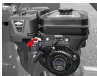
Moteur essence HONDA 6 ch ou KOHLER 7 ch