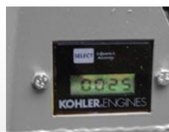
Tachyhoramètre (compte-tours avec heures de fonctionnement)