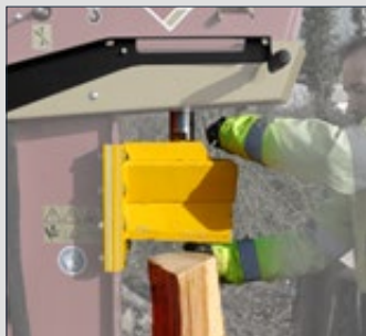
1 - Déclipser le coin du vérin pour venir le poser sur le bois