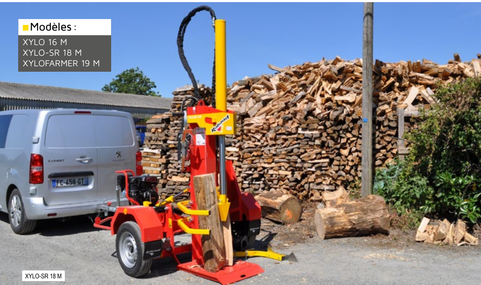
XYLO-SR 18 M