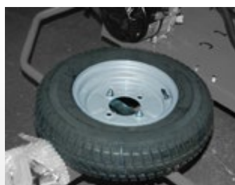
Roue de secours