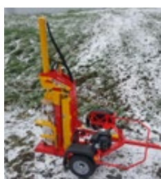
XYLO 16 M au travail