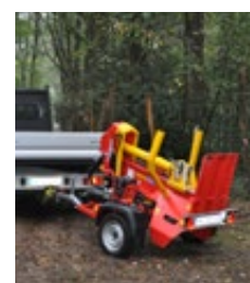
XYLOFARMER 19 M au transport