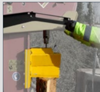
3 - Une fois le bois maintenu, actionner le vérin pour le reclipser dans le coin