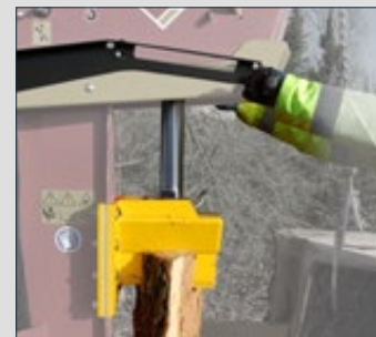
4 - Fendre vos bûches