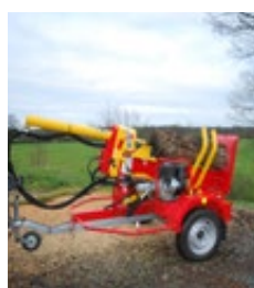
XYLO-SR 18 M au transport