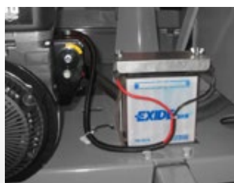
Démarrage électrique ou par lanceur